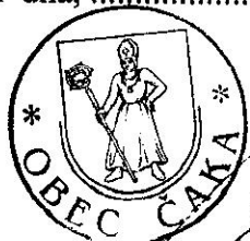
Ludovít Viglaš štatutárny zástupca PO/FO